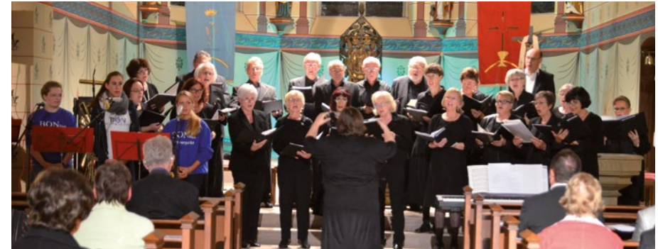
Auftritt der Schola in der Kirche Herz Jesu

Wortgottesfeier zu Maria im Vitanas Senioren Centrum