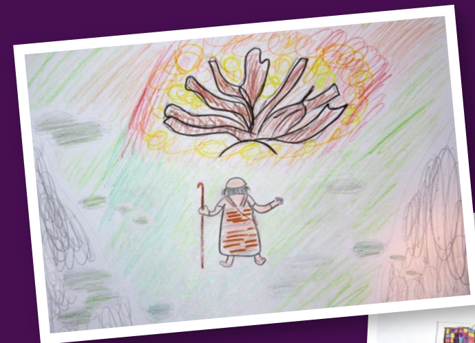
Mose am Dornbusch

Begleitender Kinderwortgottesdienst im Gemeindesaal