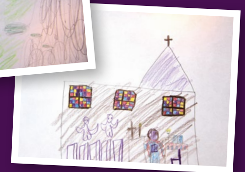
Kigo in der Kirche